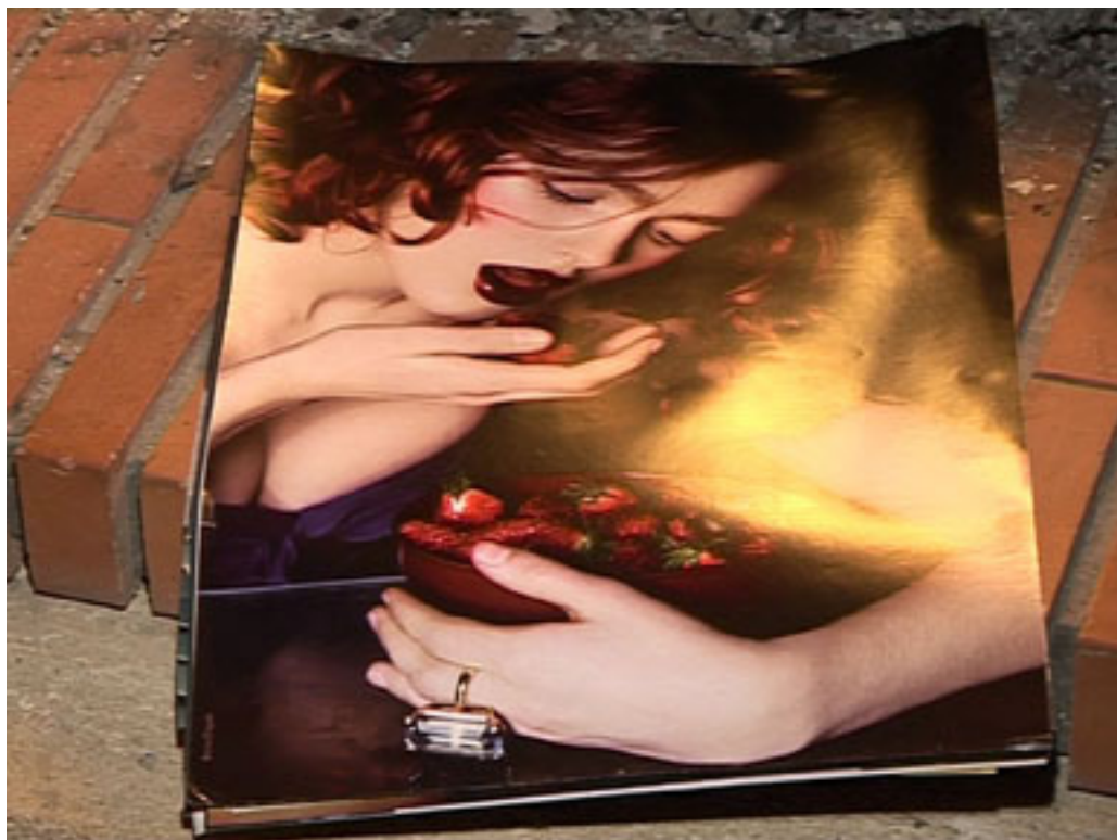
documentation céline duval, Les allumeuses , 1998 – 2010, détail: manger, durée : 3' 13''.