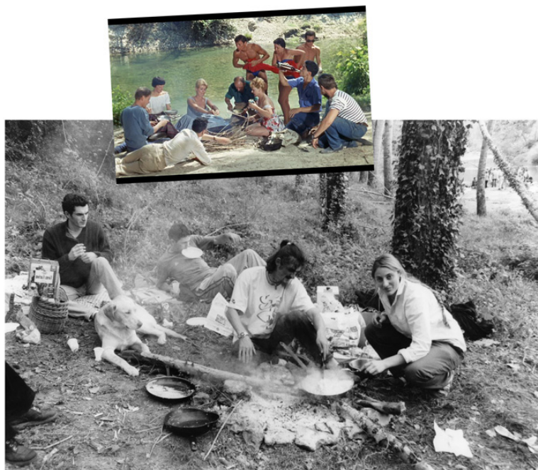
documentation céline duval et Alice Laguarda, Les délices de l'écran , 2012. Crédit : Le déjeuner sur l'herbe de Jean Renoir, 1959 / Fonds Prouchet Dalla-Costa.